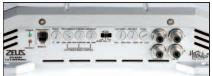
Beim Zeus: Die Ausstattung der beiden Hifonics-Verstärker ist fast identisch und mit Bass-Equalizer, Phase-Shift und Subsonicfilter sehr alltagstauglich.

Widmen wir uns zunächst den Gemeinsamkeiten: Sowohl die Brutus BXi 4000 D (600 Euro) als auch die Zeus ZXi 2201 (400 Euro) kommen im erwähnten Traditions-Kühlkörper, der zusammen mit einem blau und weiß beleuchtbaren Hifonics-Schriftzug aus Acryl einen hochwertigen