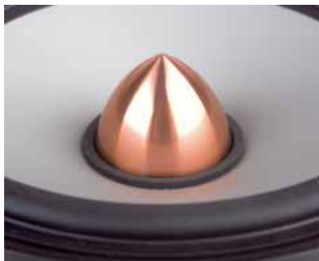
Edel, teuer und gut gegen Verzerrungen: Phase-Plug aus massivem Kupfer

Pegelanpassung ist prima ausgelegt; neben sinnvoller Abstufung gefällt die Spannungsteilerschaltung, die im Gegensatz zu Vorwiderständen die Trennfrequenz bei den verschiedenen Pegeln relativ konstant hält. Der Woofer sieht ein 12-dB-Filter, dessen Querkondensator per Widerstand abgesoftet ist, während sich die Serienspule mit zwei Abgriffen in ihrem Wert einstellen lässt. Dies bewirkt eine Mittenanpassung je nach Einbauplatz im Auto. Stichwort Mitten: Die für Hartmembranen typische Resonanz wird wirkungsvoll bekämpft, ein unbedämpfter Saugkreis zieht die Frequenzen um 5 kHz wirkungsvoll runter, wie man sich bei den Messungen überzeugen kann.