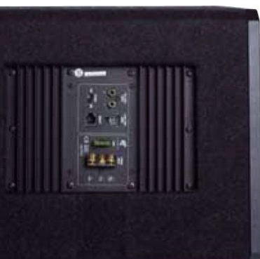
Das Verstärkermodul ist quer eingebaut, damit es in das flache Gehäuse der 20er-Woofers passt. Es findet sich ebenfalls eine vollständige Ausstattung

Zwei 20-cm-Wooferschassis (je 8 Ohm in Parallelschaltung) übernehmen die Schallabstrahlung zusammen mit einem gemeinsamen Bassreflexrohr, das sogar einen Knick aufweist, um in dem kompakten Gehäuse die notwendige Länge unterzubringen. Die schnuckligen Achtzöller arbeiten mit echten Glasfaser-/Carbonfasermembranen. diese sind leicht und hochstabil, zumal der spitze Öffnungswinkel die Konusform sehr stabil macht. Der Blechkorb der Woofer weist zahlreiche Belüftungsöffnungen auf, die Polplatten sind geschwärzt und nebenbei auch ordentlich gestanz. Die Elektronik ist zweigeteilt, das ermöglicht die Unterbringung des Verstärkers unauffällig auf der Rückseite, während die Regler an der Seite zugänglich sind. Der einzige Kritikpunkt ist, dass die Reg-