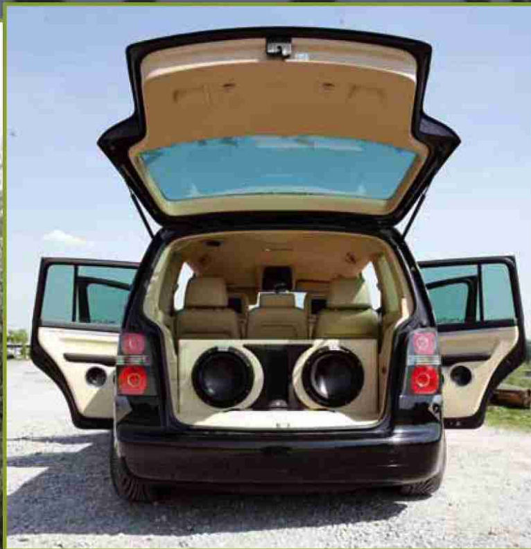
Die Beledung mit bielastischem Kunstleder wird mit kontrastfarbigen Nähten zum Hingucker