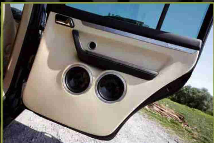
In den hinteren Türen laufen Hoch- und Tieftöner über Frequenzweiche angetrieben von der 600-2

Er schätzt die Navieinheit mit 3D-Ansicht und ultraschneller Berechnung und die Bluetooth-Freisprecheinrichtung mit Stereo-Audio-Streaming. Das Feintuning des 3sixty überließ Matthias nicht dem Einbauer, sondern experimentiert selbst mit der Klangjustierung. Am liebsten würde er für jeden Track eine eigene Einstellung speichern, um das optimale Klangergebnis zu gewährleisten. Matthias ließ uns an seinen Lieblingsongs teilhaben. Katherine Jenkins' „Habanera“ erfüllt den Innenraum mit der ganzen klanglichen Fülle dieser Ausnahmestimme. Dank der 4 Lagen Alubutyl in der Tür, im Kofferraumboden und in der Heckklappe versetzt Sven Väth lediglich Dach und