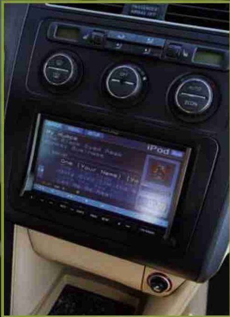
Die Original-VW-Navigation wurde durch ein Alpine IVA-W520R mit Navigation im Einbaurahmen ersetzt