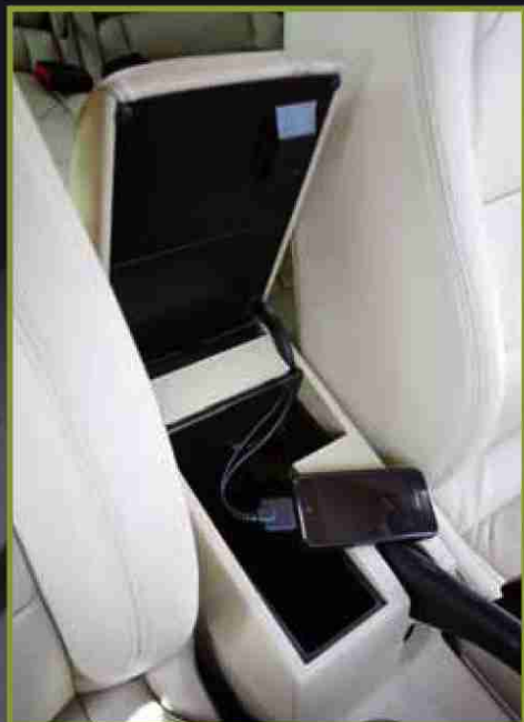
In der Mittelkonsole befinden sich Anschlüsse für iPod und iPhone