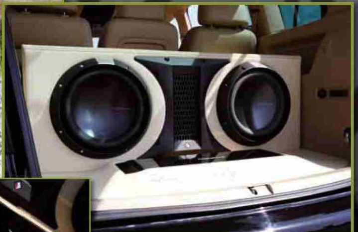
Die Subwoofer erhielten ein durchgehendes Bassreflexgehäuse mit 165 Litern Gesamtvolumen