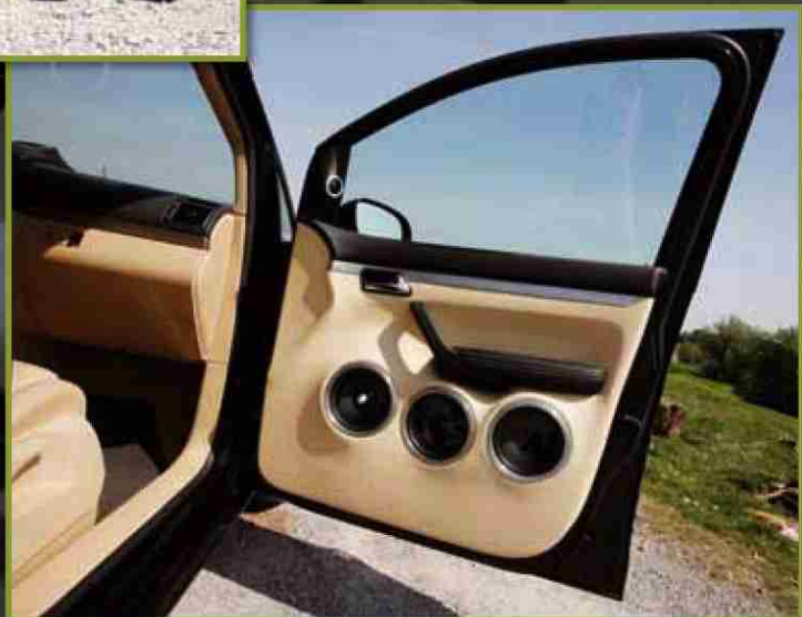
Aluminiumringe für die Lautsprecher wurden auf der Drehbank von Tim Nees handgedreht