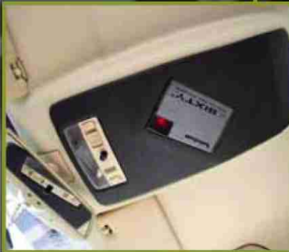
Der 3sixty im Dachhimmel wird über den Regler am Armaturenbrett oder einen PDA gesteuert