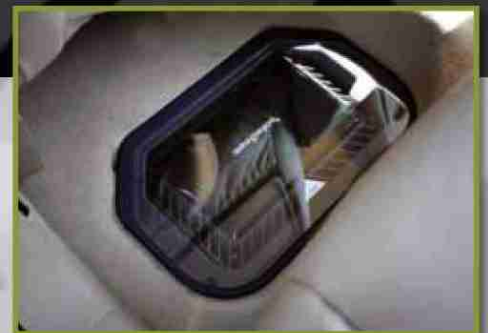
Im hinteren Fußraum versenkt eingebaut: die T600-2 Endstufe