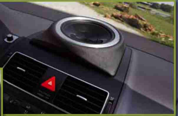
Ursprünglich für Navi und Freisprechen vorgesehen beweist der Centerspeaker nun auch bei DVDs und Filmen seine Qualitäten